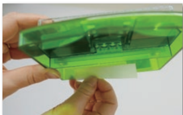
② 後側 (内側)