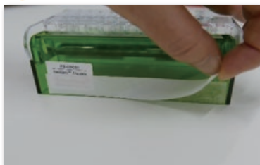
① 後側 (表面)