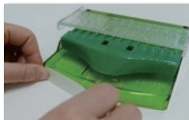
③, ④ 前面2箇所 (外側・内側)