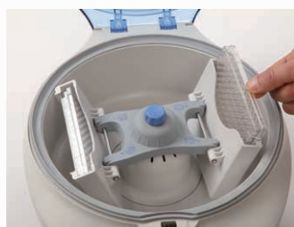
2. ELISAプレート (アダプター不要)