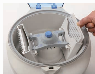
4. 0.2ml PCRチューブ/8連PCR チューブ (要専用アダプター)