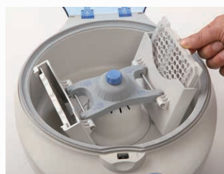
3. セミスカート/ノンスカート プレート (要専用アダプター)