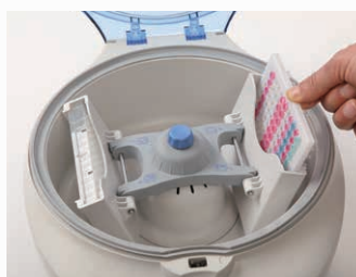
1. フルスカートプレート (アダプター不要)